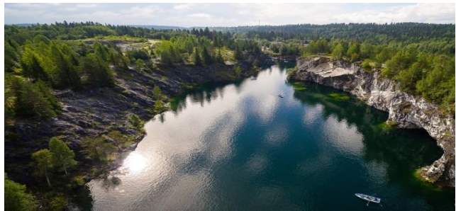
Горный Парк Рускеала