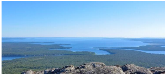
Национальный парк Паанаярви