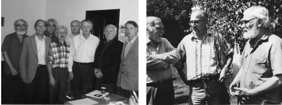
Среди членов Союза писателей России.

поэтами и художниками, чья мастерская стала желанным прибежищем для тульской творческой молодежи, живым уголком нормального общения мастера с учениками, учебы у него.