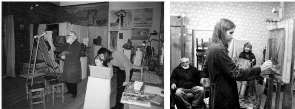
В мастерской с учениками

шедевром является альбом графики художника. Наброски, рисунки, иллюстрации, вошедшие в него, стихи, как бы вкрапленные в художественный текст, прибавляют своеобразия и новизны авторского откровения, внутреннего мира его.