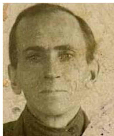
Таким он стал в 1937 году после двух безвинных отсидок в тюрьме, смертельно больной туберкулезом...