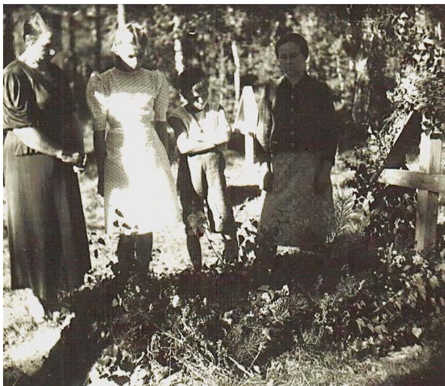
Прощание с могилой папы... Лебяжье, сентябрь 1945 года.

Перед отъездом мы в последний раз пришли на все еще свежую могилу папы... С тяжелым чувством я навсегда расставалась с ним. Его светлая любовь, доброта и тепло оставили в моей душе глубочайший след и неизменно саднящую рану на всю оставшуюся жизнь. В самые трудные ее моменты, когда я падала без сил от голода, я мысленно разговаривала с отцом и обещала ему: «Я выживу!.. Я выживу и все равно буду учиться, как ты того хотел!..»