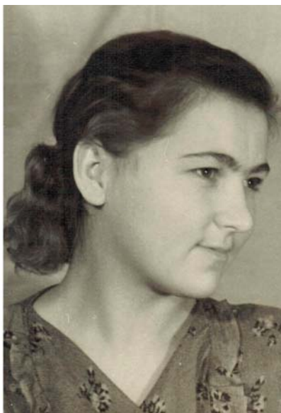
Я на пятом курсе, Москва, 1953 год

На похороны Вождя пройти было невозможно. И Москву, да и всю страну охватил какой-то массовый психоз. Толпы обезумевших людей стремились все к тому же Колонному залу. Убитые горем люди хотели отдать последний долг Вождю любыми способами, не отдавая себе отчет в том, что это может стоить им жизни.