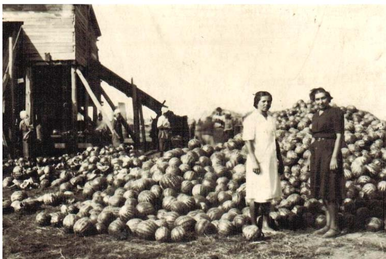
Медоварка, 1940 год

Чтобы получить семена арбузов, был построен специальный заводик, очень простой по замыслу, но с большим экономическим эффектом. Мы его называли медоваркой. Там арбузы, разрубленные ножами-тесаками на специально вращающихся кулачках в виде торпеды с ребрами (из нержавеющей металлического сплава) очищались от мякоти, калгушки (корки) сбрасывались в отсек, а мякоть сливалась самоотеком на специальные сита. Там семена пустые отделялись от полноценных, сок, пройдя через несколько сит, стекал в специальные емкости, а отжатая мякоть шла по своему каналу. Из сока варился замечательный мед. Для этой цели строились временные печи (горны) с отверстиями для медных тазов, в которых производилось уваривание сока до определенной кондиции. Он густел, приобретал светло-коричневую окраску, и готовность его определяли так же, как варенье — по капле. Готовый мед сливали в деревянные кадки, которые плотно укупоривали. Большая часть сваренного меда куда-то отправлялась: он пользовался спросом. Но немалая часть его оставалась для внутреннего потребления. Для сотрудников он стоил очень дешево. Я этот мед любила больше, чем пчелиный. С ним мы ели домашнюю ряженку (видимо, прототип йогурта, только вкуснее и полезнее, так как в нем было много фруктозы). К сожалению, когда я навещала поселок в 2003 году, медоварки уже не было. В нынешнем Российском государстве как-то больше принято не создавать, а разрушать созданное.