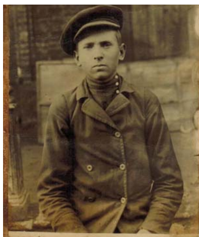
Таким был мой папа в 1917 году, 17-ти лет от роду...