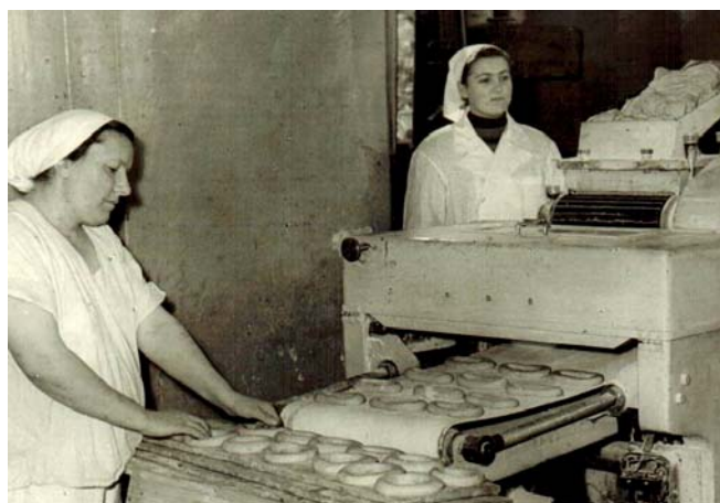
На освоении новой машины по производству бубликов, хлебозавод № 4, г. Тула, 1957 год

На Скопинском хлебокомбинате состыковались две эпохи хлебопечения — начала XX века и периода индустриализации страны. На нескольких пекарнях комбината замес теста производился вручную в больших деревянных ящиках типа колод. Описание такого производства есть у Максима Горького в рассказе «Двадцать шесть и одна». Это тяжелый, изнуряющий труд, особенно когда замешивается тесто из пшеничной муки. И в то же время были хлебозаводы с современным технологическим оборудованием: установленными просеивательными и тестомесильными машинами. Там были даже тестоделители. Мне потом пришлось заниматься заменой устаревшего дореволюционного оборудования этой новой техникой.