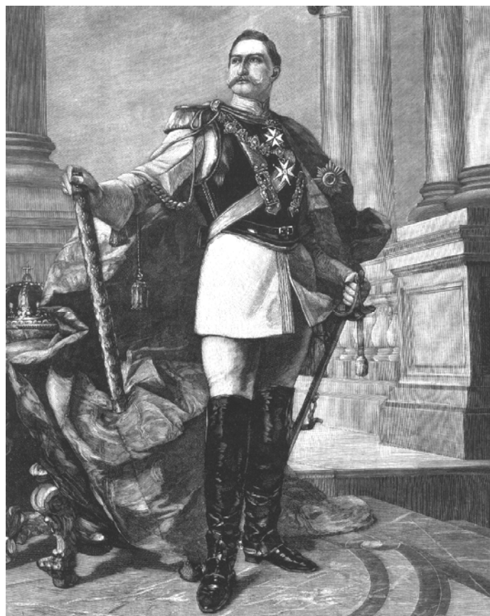
Легендарный родоначальник династии императоров Хиндельбраанта

Помнился прием военным президентом государства, исполнявшим заодно и обязанности (не предусмотренного конституцией) гражданского главы государства. После напыщенной церемонии гости возложили венки к подножию километровой высоты монумента — к памятнику легендарного основателя Хиндельбраанта Дюрхику-воителю.