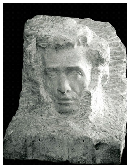
Семенов С. С. (1932–2012). Портрет А. С. Пушкина. 1997 г. Мрамор. 45×35×35