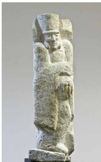
Самылов С. Н. (род. 1936). А. С. Пушкин. 1988 г. Камень. 64×23×15