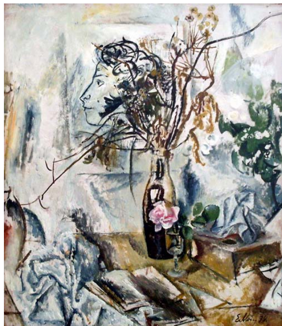
Моисеенко Е. Е. (1916—1988). Натюрморт с рисунком А. С. Пушкина. 1976 г. Картон, масло. 140×150