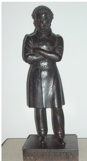
Теребнев А. И. (1815–1859). А. С. Пушкин. 1837 г. Чугун, литье. В. 45