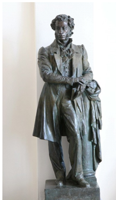
Аникушин М.К. (1917–1997). А. С. Пушкин. Модель скульптуры для МГУ. 1952 г. Гипс тонированный. 190×79×60