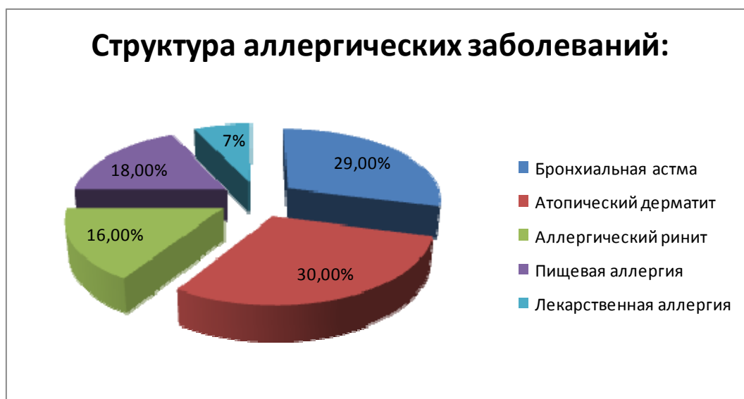
Рис. 2. Структура аллергических заболеваний у часто и длительно болеющих детей

Исследование уровня общей и специфического иммуноглобулина Е позволило обнаружить повышение его у 26 детей (28,3%).