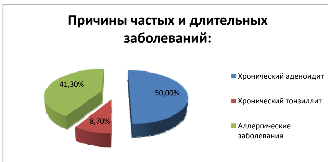
Рис. 1. Причины частых и длительных заболеваний у обследованных детей

Результаты и их обсуждение. Основной причиной частых и длительных заболеваний у обследованных детей являлась хроническая патология рото- и носоглотки. Более чем у половины детей (50%) – это хронический аденоидит. Хронический тонзиллит диагностировали у 8,7% детей (рис. 1). У 38 детей (41,3%) регистрировались аллергические заболевания: у 29% – бронхиальная астма, у 30% – atopический дерматит и у 16% аллергический ринит, у 18% пищевая аллергия и у 7% лекарственная аллергия (рис. 2).