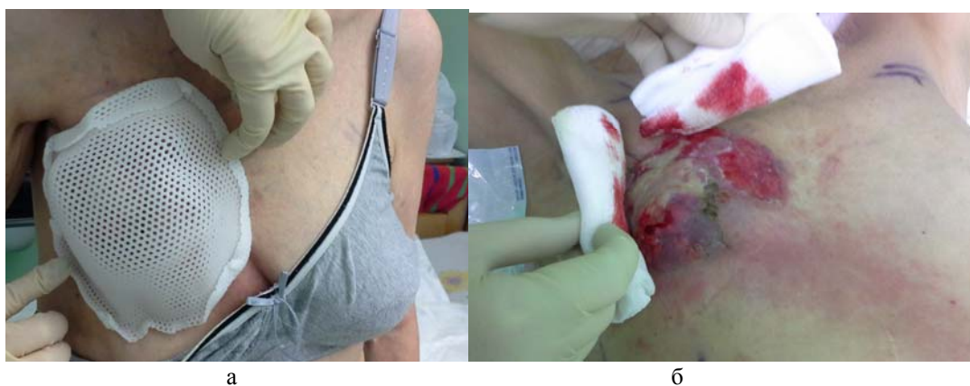
Рис. 2. а – индивидуальный термопластиковый каркас, б – перевязка с опытными образцами альгинатных гелей

Перед сеансом лучевой терапии осуществлялись перевязки, ежедневно на область язвы наносили гель с \epsilon -аминокапроновой кислотой. К 8-му сеансу лучевой терапии, что соответствовало СОДф 24 Гр, было отмечено уменьшение кровоточивости, неприятного запаха, объема образования. 2/3 поверхности опухоли покрылось фибрином, стала отмечаться эпителизация краёв опухоли. С поверхности опухоли были взяты мазки-отпечатки. Цитологически определён детрит, фибрин, скопление лейкоцитов, опухолевые элементы не обнаружены. С целью уменьшения травматизации поверхности опухоли был смоделирован каркас из термопластика, были применены опытные образцы гидрогелевого материала на основе альгината натрия с модифицированным серебром (3 ммоль), содержащий альгината натрия ( 70 \pm 0,7 ) мг/г и модифицированное серебро ( 15 \pm 1,5 ) мг/г (рис. 2).