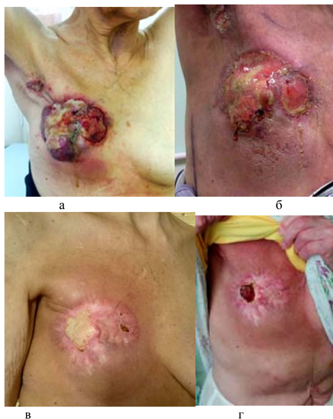
Рис. 3. Изменения кожи и опухолевого образования во время проведения лечения. а – октябрь 2015 г., б – январь 2016 г., в – апрель 2016 г., г – май 2016 г.

Результаты и их обсуждение. Несмотря на то, что за последние годы в ранней диагностике РМЖ и лечении достигнуты большие успехи, количество больных с местно-распространенной стадией остаётся значительным. Как правило, это пациенты, которые ведут активный образ жизни, а значит особую важность приобретает улучшение ее качества.