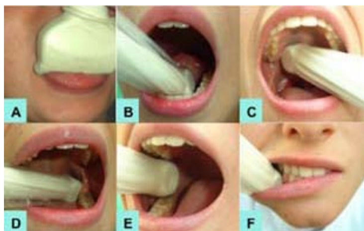
Рис. 3 Ультразвуковая методик исследования: A- deep lingual a., B- sublingual a., C- greater palatine a., D- inferior alveolar a., E-buccal a., F- mental a. (адаптировано из [11])