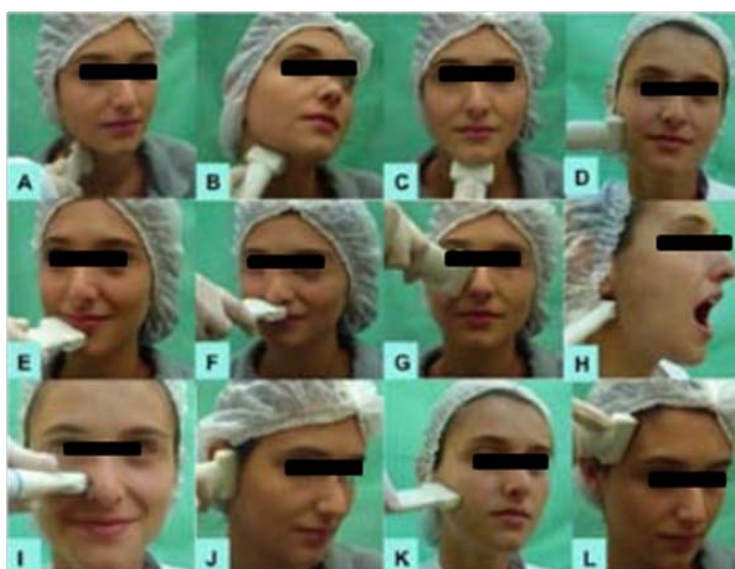
Рис. 2. Ультразвуковая методик исследования: A-external carotid a., B-lingual a., C- submental a., D-facial a., E- inferior labial a., F- superior labial a., G- angular a., H- maxillary a., I- infraorbital a., J- temporal superficial a., K- transverse facialis a., L-frontal a. (адаптировано из [10])

Tucunduva M-J. et al. [11] при помощи ультразвукового исследования изучили расположение и параметры лицевой и др. артерий лица (диаметр, систолическая пиковая скорость, резистентный индекс) у 20 здоровых человек (9 мужчин и 11 женщин) в возрасте от 20 до 57 лет. Всего было проведено 40 исследований с использованием доплера в В-режиме с использованием портативного ультразвукового аппарата Terason t3000 ( Teratech Corporation , Берлингтон, Массачусетс, США) и линейного датчика 5-12 МГц модели 12L5 и внутривидеостробильного датчика 4-8 МГц модель 8EC4 (рис. 2, рис. 3). Лицевая артерия была исследована в месте пересечения границы нижней челюсти с передней границей жевательной мышцы и вблизи губной спайки. Tucunduva M-J et al. [11] установили, что средний диаметр лицевой артерии составлял 2,14 мм, подбородочной артерии – 1,69 мм, нижней губной артерии – 1,66мм, верхней губной артерии – 1,63 мм, угловой артерии – 1,39 мм и небной восходящей артерии – 1,48 мм. По мнению авторов, ультразвуковая методика при исследовании сосудов лица имеет явные преимущества, поскольку ее результаты могут быть оценены в реальном времени, она неинвазивная, недорогая, надежная и абсолютно безопасная для пациентов [11].