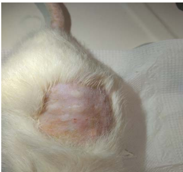
Рис. 2. Результат введения препаратов