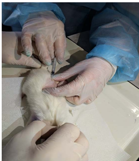
Рис. 1. Формирование модели возрастных изменений кожи с помощью препарата лонгидаза.

В процессе исследований осложнений не было. Исследования продолжаются.