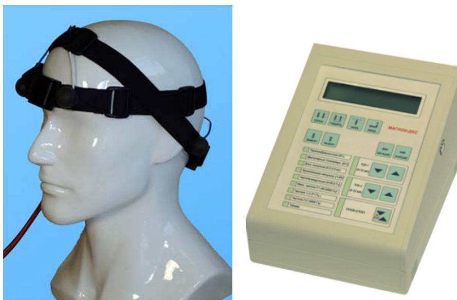
Рис. 3. «Магнон-ДКС»

Методы ТЭС и мезодиэнцефальной модуляции характерны тем, что в них не предусмотрена индивидуализации подбора параметров для каждого конкретного пациента при проведении терапии (кроме силы тока). Это значительно облегчает процесс проведения лечения для медицинского персонала: необходимые режимы воздействия могут быть извлечены из памяти аппарата «Магнон ДКС» и, единственное, что необходимо сделать – это подобрать по ощущениям пациента необходимую силу тока.