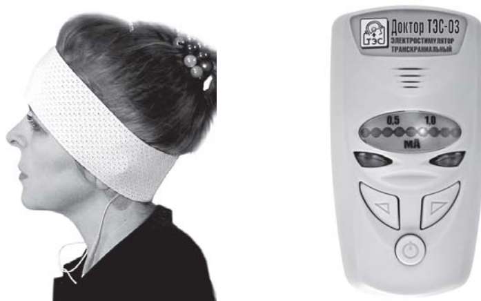
Рис. 2. «ТЭС-3»

Аппарат «Доктор ТЭС-03»– это упрощенная версия профессиональных аппаратов для ТЭС-терапии. «Доктор ТЭС» имеет один режим работы и позволяет регулировать силу воздействия от 0 до 1,5 мА. Аппарат «Доктор ТЭС-03» подходит для проведения общего профилактического курса ТЭС-терапии, а также в комплексном лечении вне стационара в периоды вне обострений, в отдаленные периоды после травм, включая послеоперационные состояния. Расположение электродов лобно-окципитальное (рис. 2).