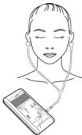
Рис. 1. «Альфария»